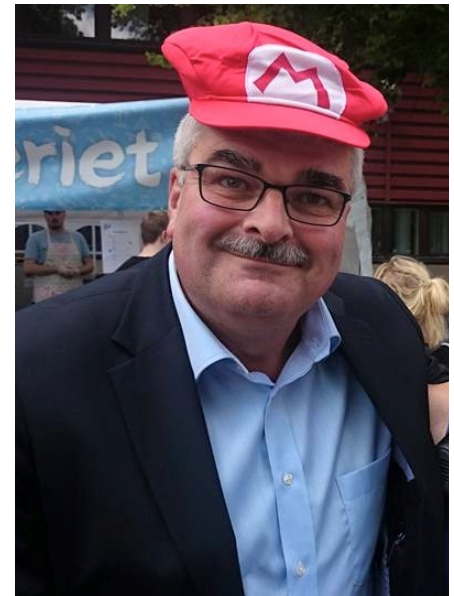
Super Mario i sin cosplay

Efter att Super Mario lämnat område var många pandor och arrangörer ledsna över att de missat chansen att träffa honom. Fronken kan meddela att tröst finns att få i Personal Service.